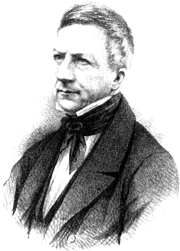
GROEN VAN PRINSTERER