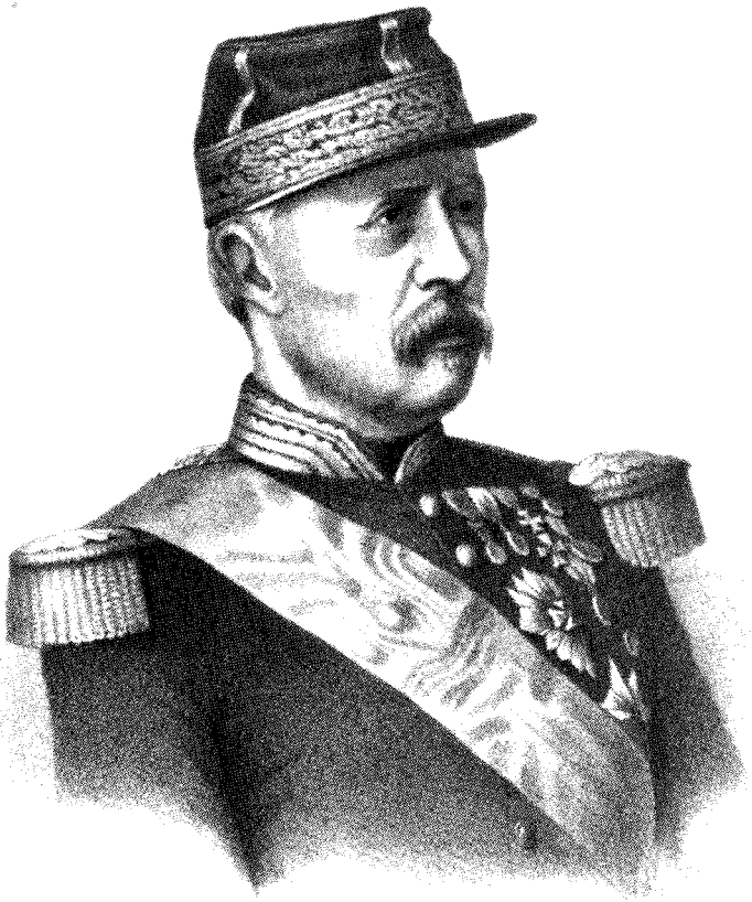
MAC - MAHON.