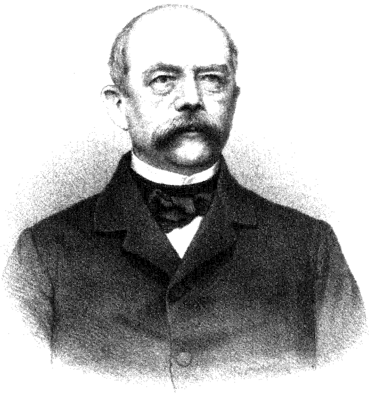
OTTO GRAF VON BISMARCK