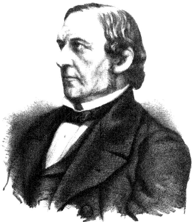
WILLIAM EWART GLADSTONE.