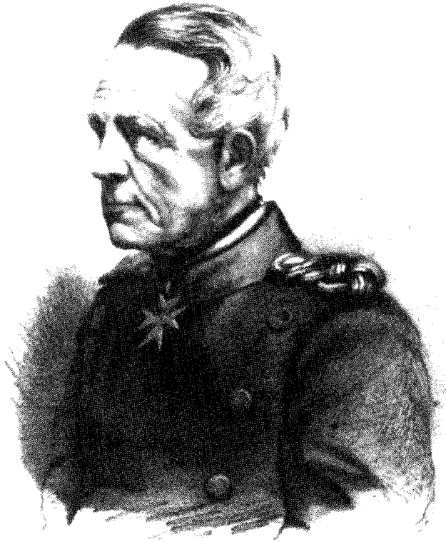
BARON VON MOLTKE